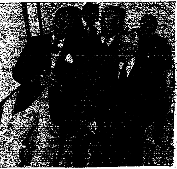
الرئيس شمعون في حديث مع الدكتور شارل مالك والابني شربل قسيس . حيث على الماشي بين الرئيس فرنجي والابني قسيس .